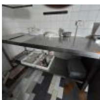
Table inox 2 m plateau d'entretoise Mise à prix :