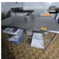
Table inox 2 entretoises grillagées 1,5 m Mise à prix :

2 Tables inox entretoise 2 m Mise à prix :